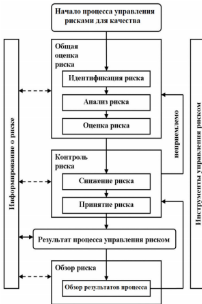
Рис. 1 Общая схема типового процесса управления рисками для качества